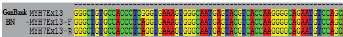
Hình 3.2. Trình tự nucleotide đoạn gen MYH7 của bệnh nhân

So sánh với trình tự tham chiếu tại ngân hàng gen (GenBank), chúng tôi phát hiện trên exon 13 có đột biến sai nghĩa do thay thế nucleotide loại Guanine (G) thành nucleotide loại Adenine (A) tại vị trí 10164, dẫn đến